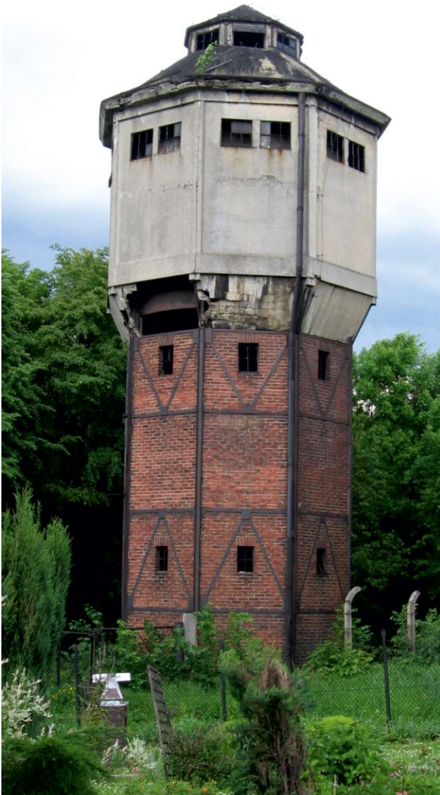
Wieża o konstrukcji żelbetowej z ceglanym wypełnieniem

W latach sześćdziesiątych XX wieku przestała pełnić swoją funkcję. Wieżę zburzono w grudniu 2006 roku.